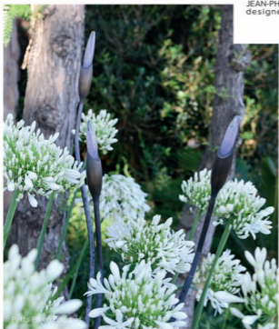
Eden Flow Bouton

JEAN-PHILIPPE WEIMER designer de lumière