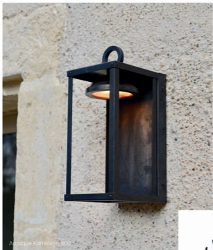
Aplique Kaméleon 800